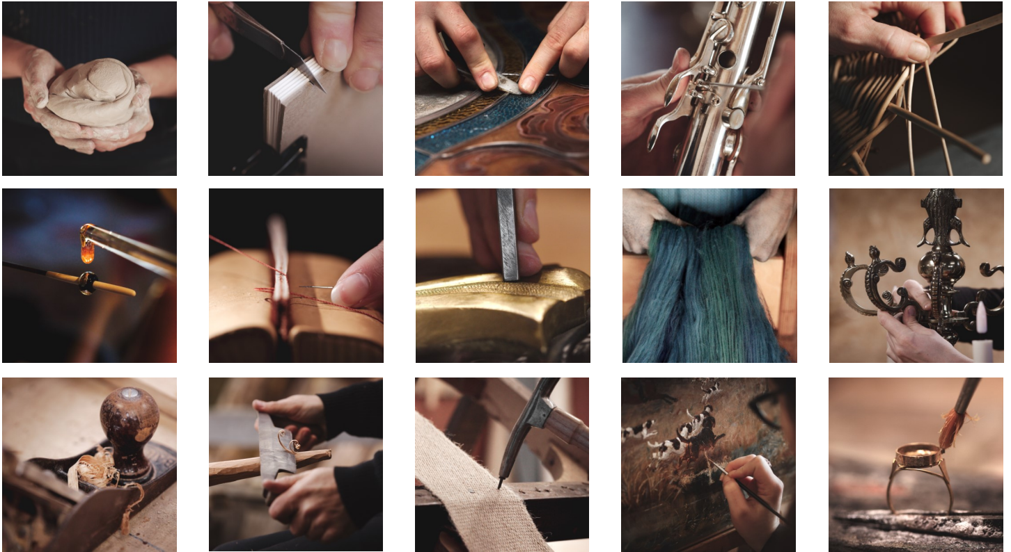
↑ Photos des gestes des artisans d'art présents aux JEMA à Cherbourg-en-Cotentin

Rdv du vendredi 5 au dimanche 7 avril pour les Journées Européennes des Métiers d'Art